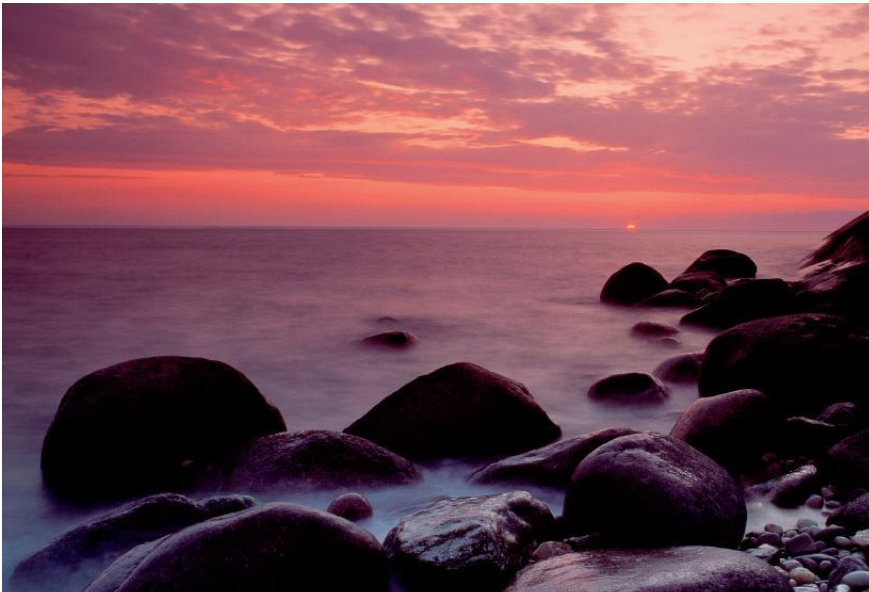
☞ SAMÚÐARKVEÐJA ☞

Eru seld á þjónustuborði Hrafnistuheimilanna og á heimasíðu Hrafnistu.